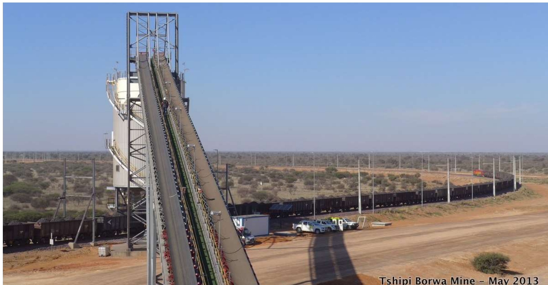
Tshipi Borwa Mine – May 2013