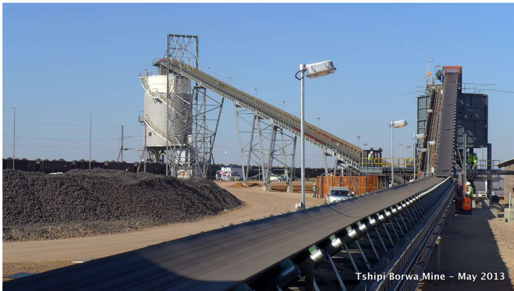
Tshipi Borwa Mine - May 2013