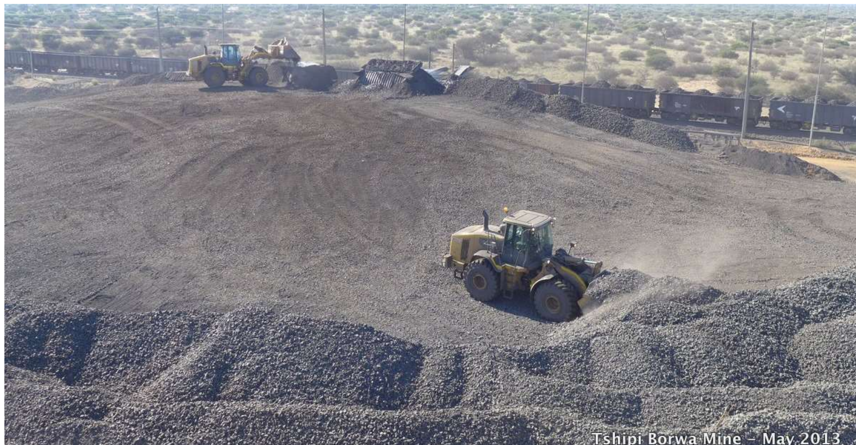
Tshipi Borwa Mine - May 2013